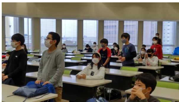
小学5・6年の部で団体2等をいただきました

2021年11月14日（日曜日）に尼崎商工会議所で 尼崎珠算振興会・尼崎商工会議所主催のそろばん競技会がありました。市内の算盤教室に通う小学生 中学生 高校生 社会人が集まり 日頃の算盤・暗算の練習の成果を競いあいました。今年も新型コロナウイルスの影響で みんなマスクをして参加 本学院からも小学5.6年の部で 6年生5名 小学4年以下の部で4年生1名が参加してくれました。上級検定終了後の短い練習時間でしたが みんなよく頑張ってくれたので 団体では 小学5,6年の部で 優勝・準優勝の次の二等をいただき 読み上げ暗算では個人で3等をいただいた人もいました